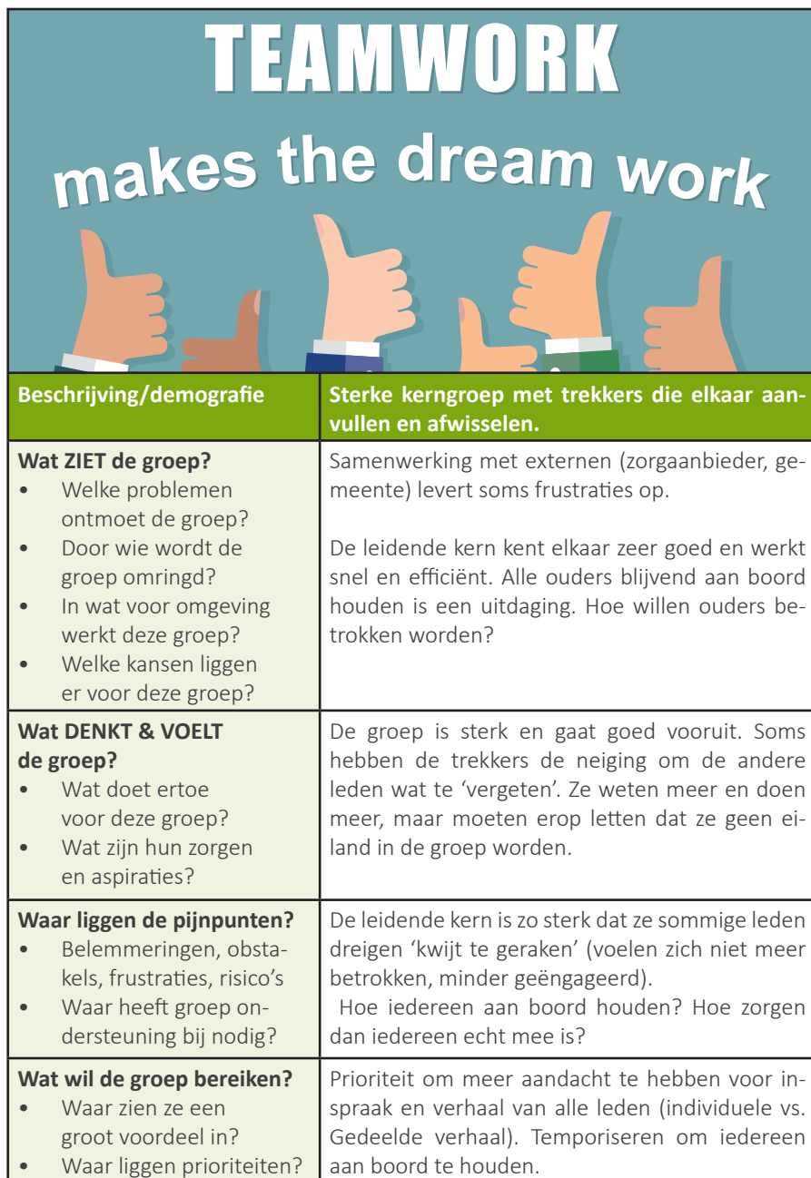
Empathy map 3: groep met sterke kerngroep van trekkers die dreigt het contact met alle leden te verliezen en eigen draagkracht te overschrijden