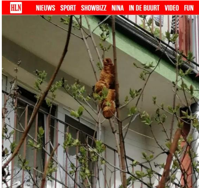
Het 'gevaarlijke' beest.