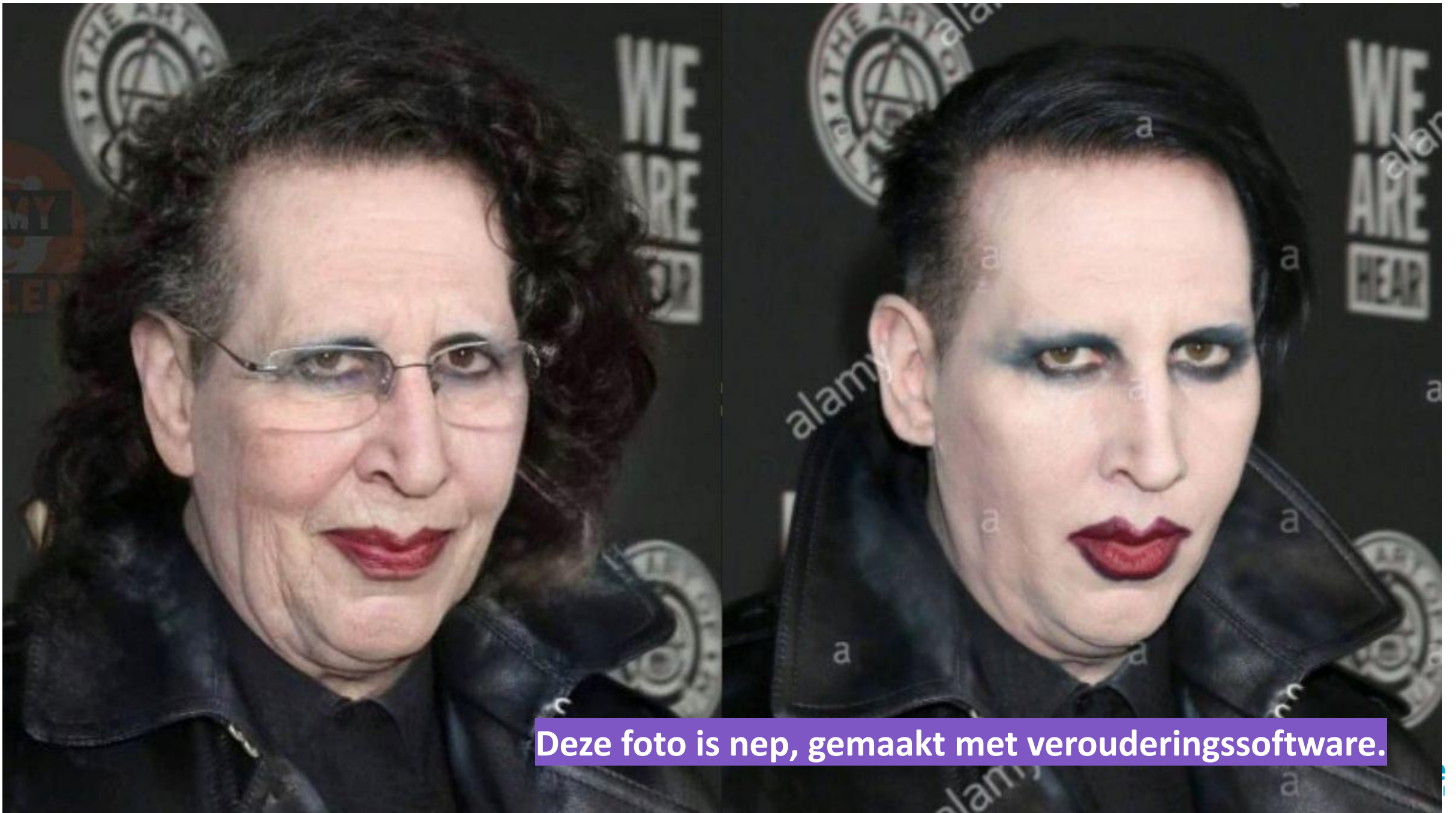
Deze foto is nep, gemaakt met verouderingssoftware.