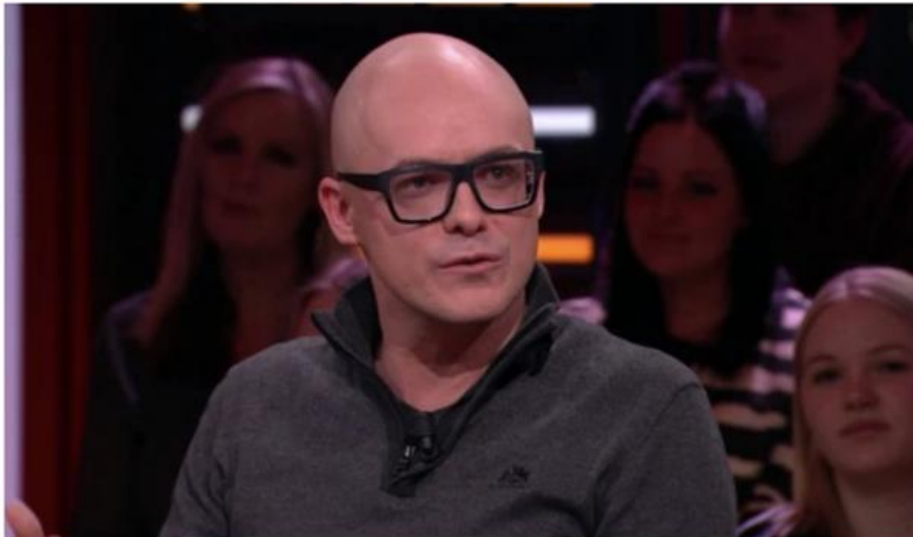
Philippe Geubels onthult nieuwe geheime investering die honderden mensen in België erg rijk maakt